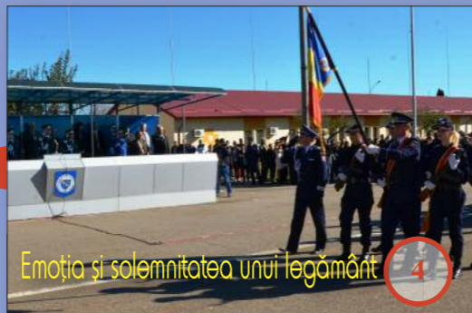
Emoția și solemnitatea unui legământ

Publicație fondată în 1939. Serie nouă. Anul XXIII