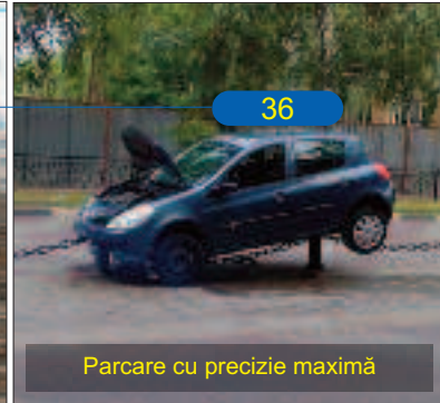
Parcare cu precizie maximă