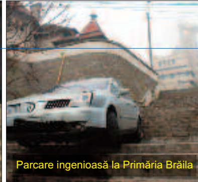
Parcare ingenioasă la Primăria Brăila