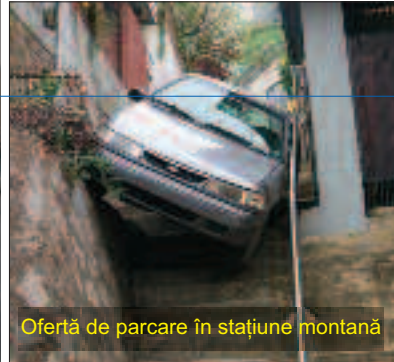
Ofertă de parcare în stațiune montană