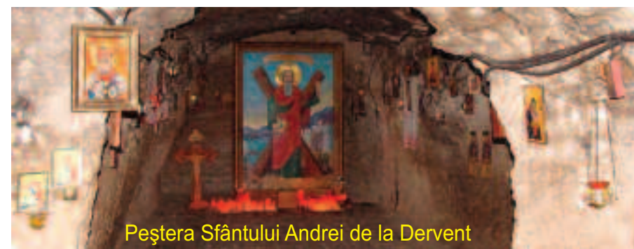
Peștera Sfântului Andrei de la Dervent

Cuviosului Dimitrie cel Nou, Ocrotitorul Bucureștilor, a fost adus pentru prima oară la București Cinstitul cap al Sfântului Apostol Andrei de o delegație a Bisericii Ortodoxe a Greciei, condusă de Înaltpreasfințitul Părinte Mitropolit