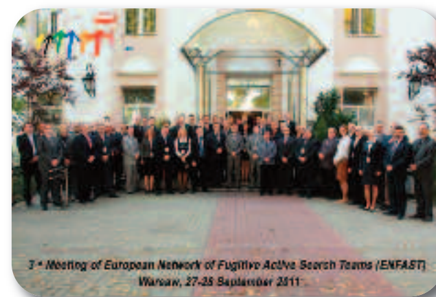
3 rd Meeting of European Network of Fugitive Active Search Teams (ENFAST) Warsaw, 27-28 September 2011