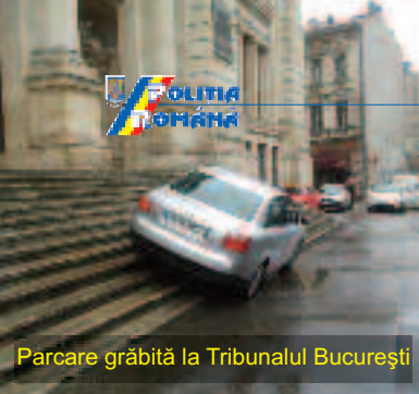
Parcare grăbită la Tribunalul București