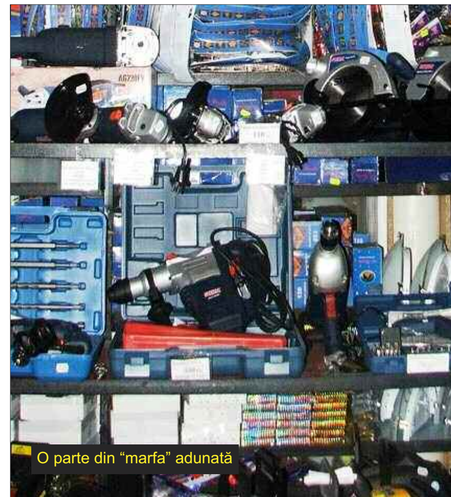
O parte din „marfa” adunată