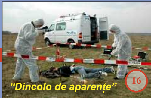
"Dincolo de aparențe"

Publicație fondată în 1939. Serie nouă. Anul XXII