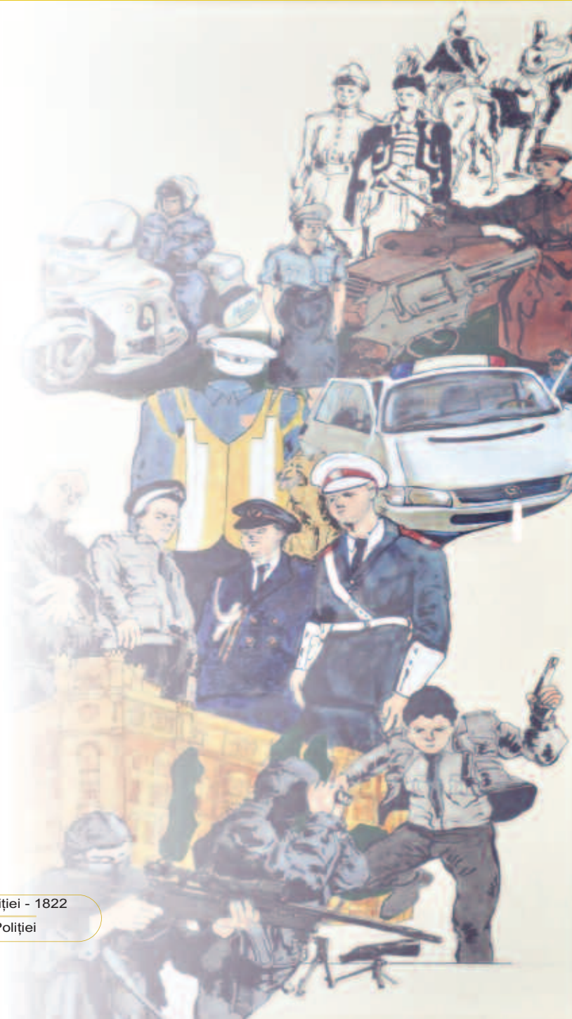
Explicație foto coperta patru: Primul drapel al Poliției - 1822 Revistă editată de Inspectoratul General al Poliției

If we awakened your curiosity about our institution, visit our site www.politiaromana.ro .