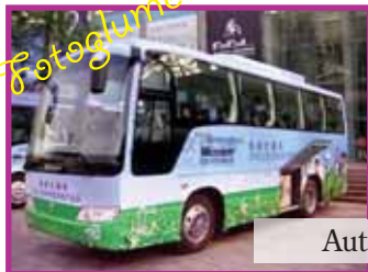
Autobuz școlar în Japonia