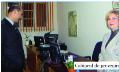
Cabinetul de prevenire și consiliere