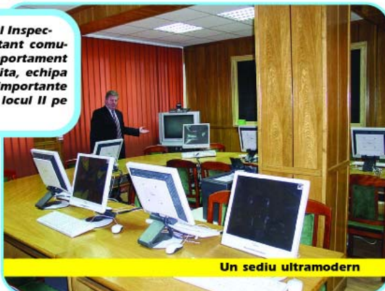
Un sediu ultramodern

Nu în ultimul rând, un dar din partea comunității harghiteni este încrederea pe care ne-o acordă. Avem o nouă pagină web, unde există și un chestionar privind activitatea Poliției harghiteni și ne bucurăm că am avut foarte mulți vizitatori, mai mult de jumătate din populația municipiului Miercurea Ciuc, sau dacă vreți, 15 la sută din populația județului. Astfel, 23.264 cetățeni au răspuns la sondajele de opinie realizate de noi, apreciindu-ne. Și pentru că ne referim la tehnică, trebuie să pe-