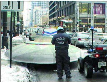
OZN amendat pentru parcare ilegală

☺ foto glume ☺ foto glume ☺ foto glume ☺