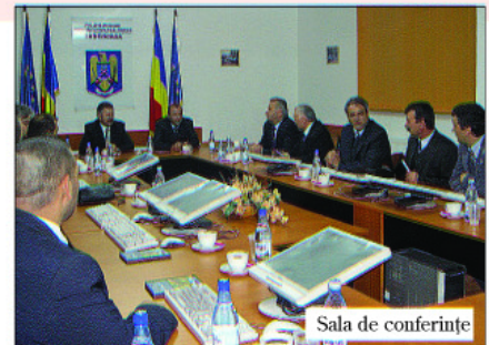
Sala de conferințe