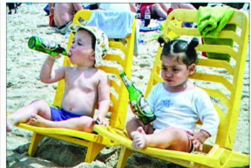
„Alcoolul nu te face mare!”