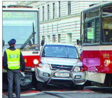
Polițist fără replică