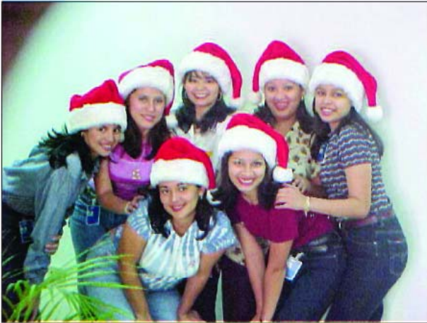
Mesagere ale speranței, un grup de crăciunițe vesele din Honduras