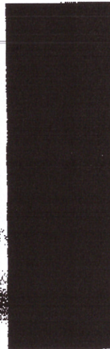
Fotografie cu capela finalizată, pusă la dispoziție de reprezentanții unității de poliție